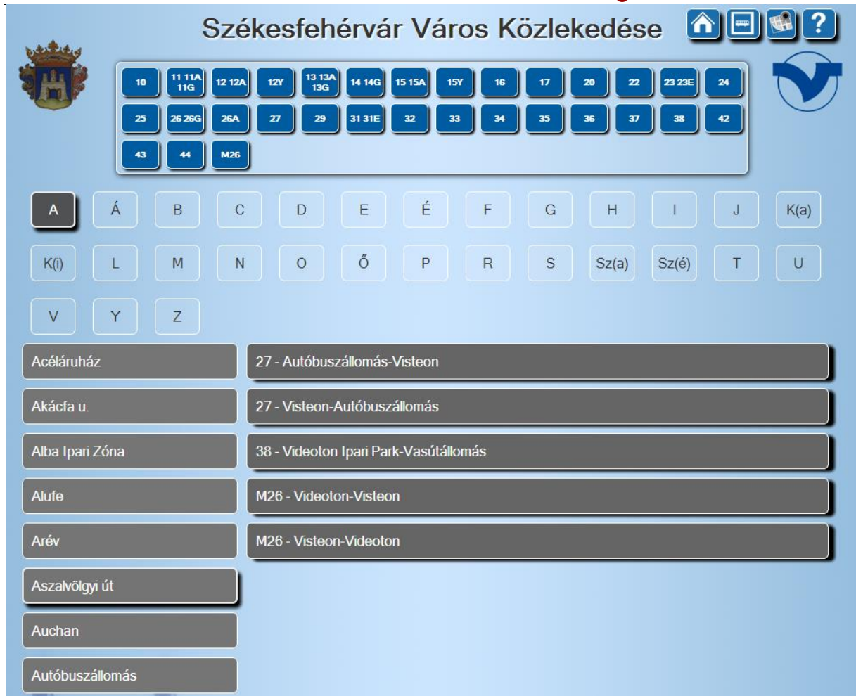
3. ábra Megállóválasztás II.